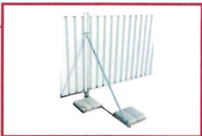
Wind Breaker støttestag med f.eks. betongheller som motvekt. Vårt beste stag ved behov for ekstra god sikring.