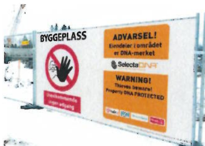
Bruk av dekkduk gir god profilering/informasjon. På grunn av lite luftgjennomstrømming kreves ekstra sikring slik at de ikke velter.