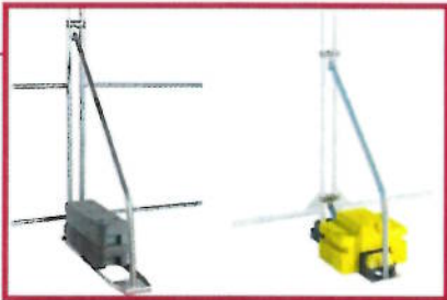
Støttestag klikk (til venstre) er et solid stag der selve "stangen" klikkes på plass i en festeplate. Støttestag for ballastblokk brukes sammen med gul fot, løftesikring og ballastblokk på hele 50 kg. Bygger kun 69 cm ut fra gjerdet.