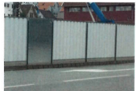
Tette byggegjerder hindrer innsyn til byggeplassen og er perfekte til bruk i bystrøk. Gjerdene gir stort vindfang, og god sikring er påkrevd.

Størst på mobile sikringsystemer i hele Norge!